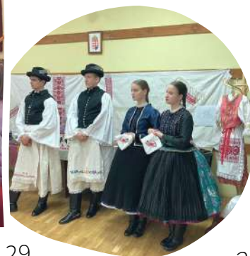
Őrhalom - május 3.