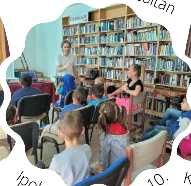
Ipolytarnóc - május 10.