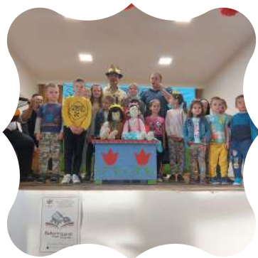
Mohora - május 13.