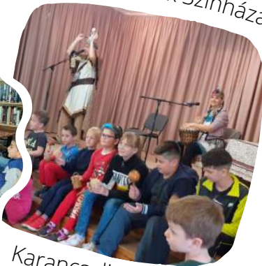
Karancsalja - május 13.