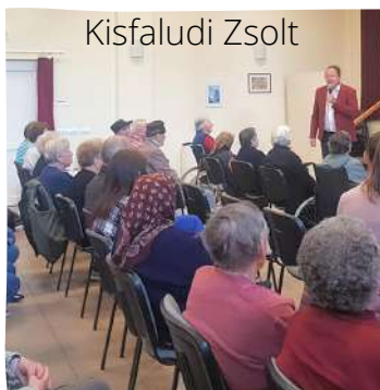
Nógrádmegyer - április 29.