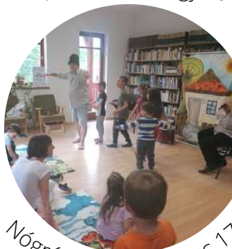
Nógrádkövesd - május 17.