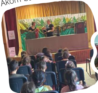
Nagylóc - május 11.