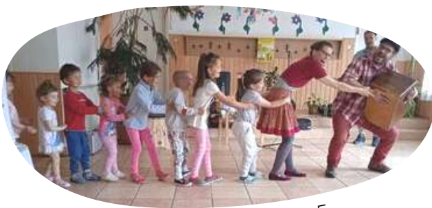
Becske - május 5.